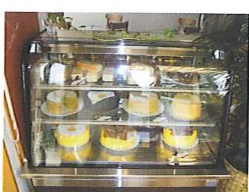
ショーケースには手作りケーキ