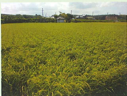
お米はたくさん収穫できました

ら聞いています。また、収穫して形の小さいものやキズが入ったものについては、むき玉ねぎにして近くの青果屋さんへ納品しています。皮をむくことは、メンバーさんにとっても楽しいようで、「今日、むき玉作業はするの？」とよく聞かれます。玉ねぎをむく時、目に涙を浮かべながらも、笑顔で楽しそうに作業している姿が印象的です。