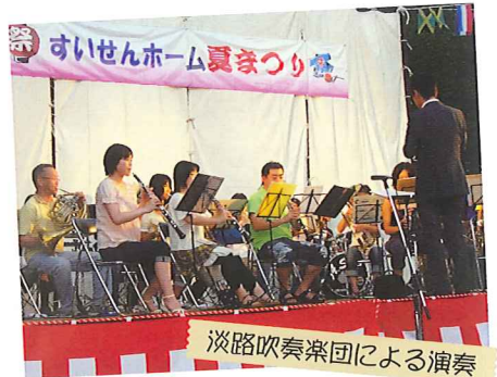
淡路吹奏楽団による演奏