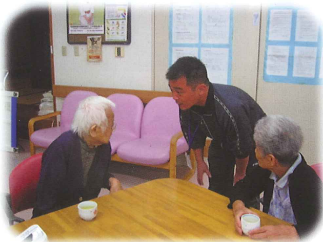
南淡デイでのひとこま

今回、この研修にご理解とご協力を頂きました各施設・事業所の皆様、実習指導者の皆様にお礼を申し上げます。