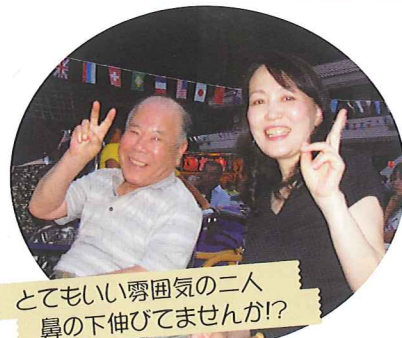
とてもいい雰囲気の二人 鼻の下伸びてませんか!?