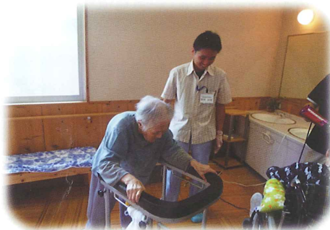
お風呂上がりに髪を乾かしてもらいました

受講生の進む道はそれぞれ違いますが、これからの介護の担い手として活躍して頂ける事を期待しています。