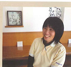
喫茶開店での抱負です