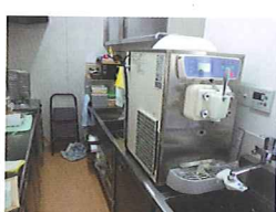
厨房機器は日本財団助成金で整備できました