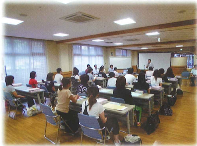
開講式・初日講義の様子

今回は、24名の皆様にご受講頂き、翁寿園地域交流ホームでの講義63時間、演習45時間を経て、各施設・事業所にて5日間の実習を終え、11月4日の閉講式を残すところとなりました。