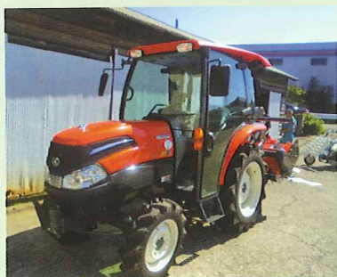
日本財団助成金で整備できました

九月には、お米を約九反分収穫し、淡路島福祉会各事業所の給食として使われることが決まっています。