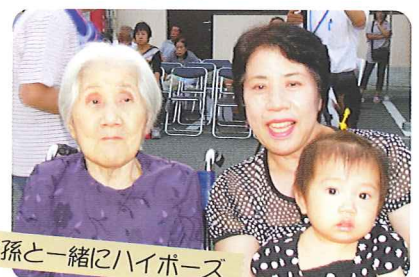
曾孫と一緒にハイポーズ