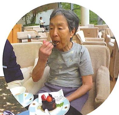
美味しそうな ケーキ(*^_^*)