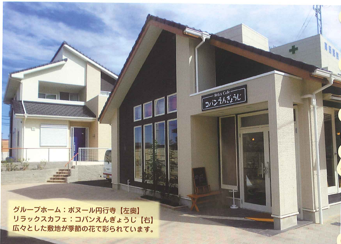
グループホーム：ポヌール円行寺【左奥】 リラクスカフェ：コバンえんぎょうじ【右】 広々とした敷地が季節の花で彩られています。

隣接して平屋でオシャレな喫茶店が十月十七日にオープンしました。利用者の方が、就労を目指す就労移行支援事業です。店内は屋根が高く暖かい日差しが入り、広々とした空間でゆったりとひと時を過ごして頂けます。有機栽培の豆を使用した珈琲、シフォンケーキやサンドイッチ、こだわりカレーなどの軽食もそろえています。喫茶を通じて地域の方々と触れ合う事で一般就労に向けての第一歩にしたいと望んでいます。