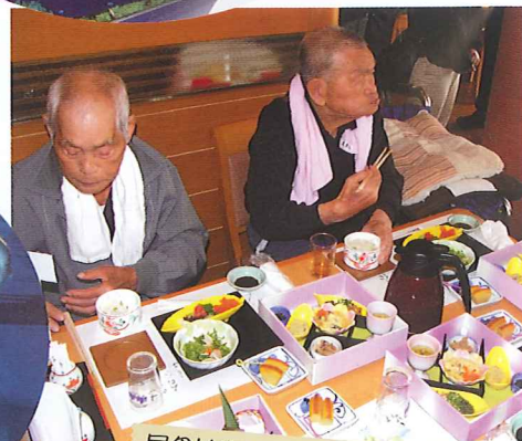
昼食はちょっと豪華に...