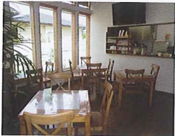
テーブルとカウンター席