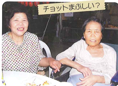
チョットまばしい?