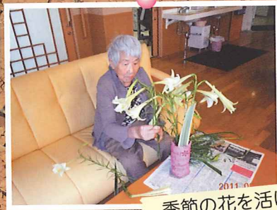
季節の花を活ける