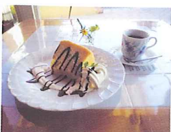
お勧めのコーヒーセットです