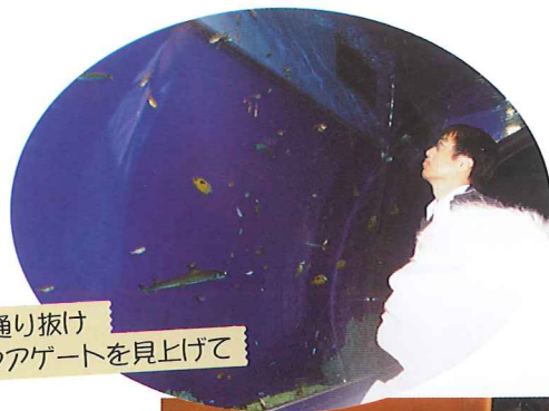
魚の通り抜け アクアゲートを見上げて