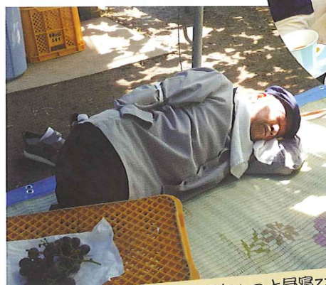
お腹一杯になってちょっと昼寝zzz