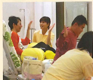
生活介護の様子です

清々しい気候の中、児童デイサービスは沢山の児童さんの声が施設内に響いています。「山」「太陽」「ロケット」「海」の各部屋で心理士や作業療法士やその他の先生方の訓練が行われています。動きの速い児童さんと体力、気力で勝負する先生との駆け引きが毎日繰り返されています。