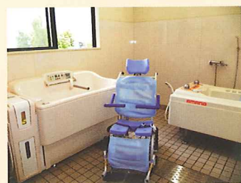
特殊浴槽が新しくなりました