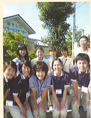
元気いっぱい、職員集合です！

清々しい気候の中、児童デイサービスは沢山の児童さんの声が施設内に響いています。「山」「太陽」「ロケット」「海」の各部屋で心理士や作業療法士やその他の先生方の訓練が行われています。動きの速い児童さんと体力、気力で勝負する先生との駆け引きが毎日繰り返されています。