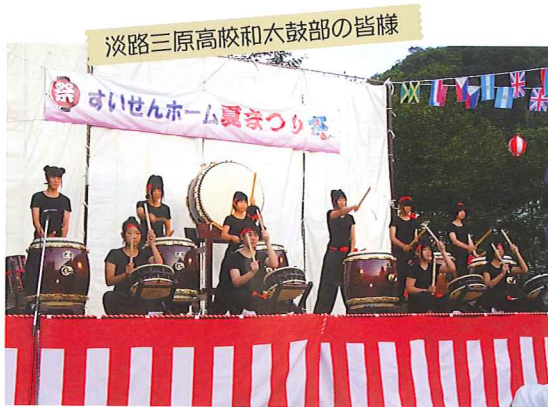
淡路三原高校和太鼓部の皆様