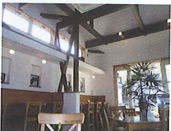
明るくリラックスできる空間です