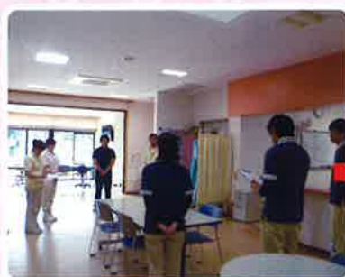
朝礼◇ 今日も宜しくお願いします<(_)_>