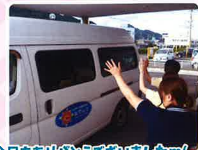
今日もありがとうございましたm(_ _)m 次回もお待ちしております★

なでしこデイサービスセンター生活介護の一日はこんな感じです。日々の活動では工作・ゲーム・DVDや音楽鑑賞・散歩・読書・ストレッチ・風船バレー・時にはお昼寝！？等を行っています。他にも買い物に出かけたり、遠足に行ったり、季節毎の行事(初詣・花見・夏祭り等々)も...利用者の皆様に楽しんでいただけるよう取り組んでいます。