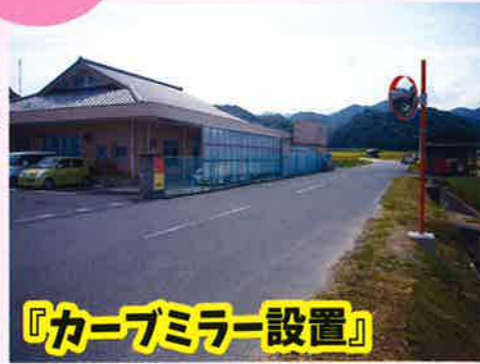
『カーブミラー設置』

きららの出入り口にカーブミラーを設置しました。周囲の確認ができ、安全に出入りすることが出来るようになりました。