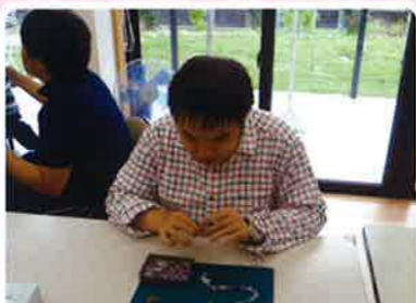
☆趣味活動☆空いている時間に... ビーズを通してネックレスやブレスレットを作ります。