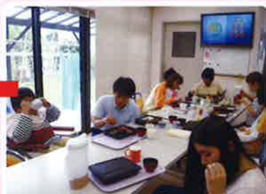
お屋前に少し体を動かして...!(^^)! ♪利用者さんも職員も楽しいお昼ご飯です♪