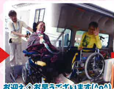
お迎え◇お早うございます(△o△) 南あわじ市と洲本市の方がご利用。 送迎範囲も広いです(^_^);