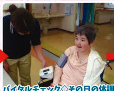
バイタルチェック◇その日の体調を確認。お風呂に入れるかしら？ (体温・血圧等測定)