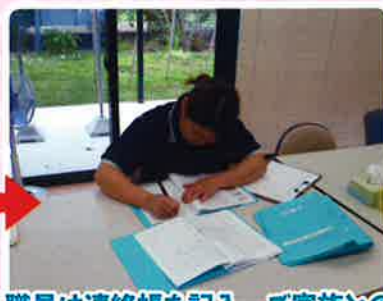
職員は連絡帳を記入。ご家族との連絡を密にします。