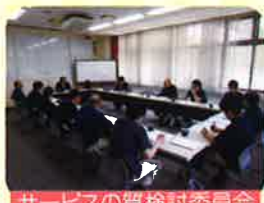
サービスの質検討委員会