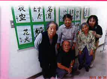
賀集公民館文化展