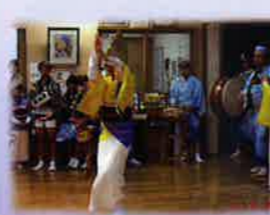
阿波踊りボランティア