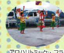
アロハリズム・フラ