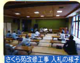
さくら苑改修工事 入札の様子