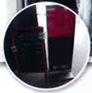
お昼時にはたくさんの方が売店に足を運ばれます。

南あわじ市庁舎内で販売活動している『COCO WA』がオープンして半年が過ぎました。庁舎の職員さんをはじめ、来庁した一般の方々にも定着しつつあり、好評をいただいております。店内には菓子パンやケーキ、また、おにぎり弁当や惣菜パン等豊富な種類の品を揃えております。皆さまもぜひ『COCOWA』を訪ねてください。