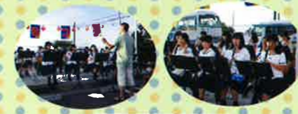
淡路三原高校吹奏楽部