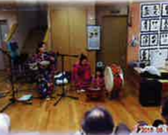
三線ボランティア