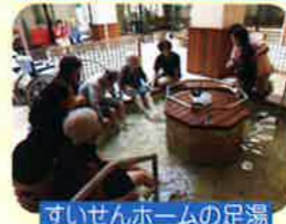
すいせんホームの足湯