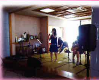
アートハウスすいせん 見学