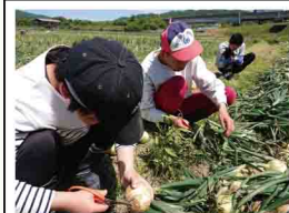
5月、収穫した玉ねぎの根切りをする様子=きらりファーム

きらりファーム 玉ねぎの収穫が終わり、徳島の八木病院、シラソール大松をはじめとした販売先で、大変ご好評いただいております。