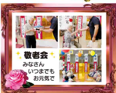
敬老会 みなさん いつまでも お元気で