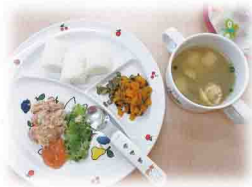
0歳児は極きざみ食

新しく元号が変わり令和元年10月、0歳児1名が入所し、入所児9名、一時保育児6名、計15名で毎日元気に遊んでいます。 2歳児はお箸が使えるようになり、1歳児は紙オムツから布パンツに移行できトイレで排泄できるようになりました。0歳児は腹ばいからつかまり立ち、伝い歩きができるようになりました。よちよちと歩けるようになった子もいます。いろんな経験をしながら一人一人成長しています。 これからも安心して保育所生活が送れるよう職員一同、心を新たに頑張りたいと思います。今後よろしく願いいたします。