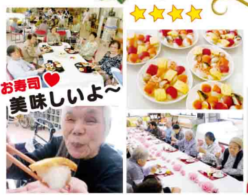
アフタヌーンティーは いかがですか?