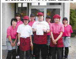
利用者と職員で記念撮影をした様子=コバンえんぎようじ