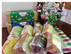
今回エントリーした商品=9月20日、神戸市中央区大会会場

念願の受賞 舞台は関西大会へ 9月20日、神戸市で開催されたスウィーツ甲子園大会においてクオーレは念願のグランプリを受賞しました。エントリーした商品は「淡路島シフォン詰め合わせ」。 8種類の味（グリーン・ロイヤルミルクレーン・キャラメルコーヒール・ココア・鳴門オレンジ・平岡農園のレモン・ほうれん草・キャラット）に淡路島の特産品や、きらりファームの野菜を使った自信作です。審査員からも「淡路島の特産品をふんだんに使用しており、非常に将来性を感じる」「一味、パッケージなど総合的にレベルの高い商品である」など、称賛の言葉をいただきました。 授産品の売上アップは利用者の工賃向上に繋がります。11月に開催される関西大会もグランプリ受賞を目指して頑張ります!