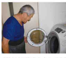
↑洗濯も手慣れたものです♪