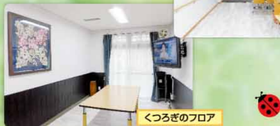
くつろぎのフロア