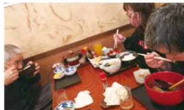
みなさんそれぞれ自分の好きなメニューを注文

ボナール円行寺とボナール地頭方の利用者さんと夕食を食べに行きました。普段一緒に生活していない利用者さんとも交流でき、楽しい時間を過ごせました。次回は、どこに行こうかみんなでご計画です♪