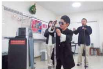
冬まつり 歌の歌謡祭