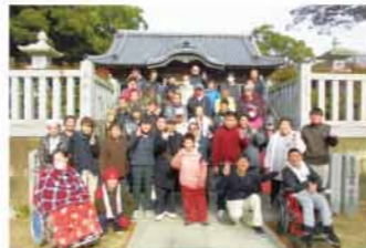
初詣 上田八幡神社