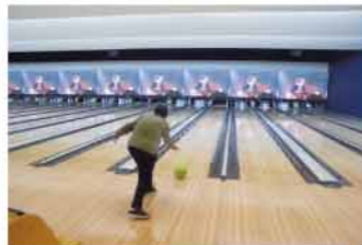
ラウンドワンでボウリング