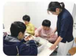
生活介護室内活動