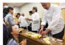
アドバイス会の様子

11月23日、テュオこうべで開催されたスイーツ甲子園関西大会に出場しました。エントリールした商品は、ブレイン・淡路島匠牛乳を使ったロイヤルミルクティー・平岡農園のレモン・自家農園のきらりファームでとれた淡路玉ねぎの4種類のシフォンケーキが入った「淡路島シフォン詰め合わせ」。すべてのシフォンケーキに北坂養鶏場のさくらたまごを使用しています。10月に実施されたアドバイス会に参加し、パティシエの方々には、体的な助言をいただき、クオリティー高い商品が完成しました。審査会の結果は残念でしたが、審査員の方々からは「非常に将来性の感じられる商品である。」とお褒めの言葉をいただきました。神戸新聞にも試食・販売ブースの様子が掲載されました。