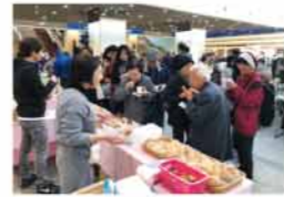
会場で淡路島シフォンを買い求める来場者の様子