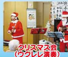
クリスマス会(ウクレレ演奏)