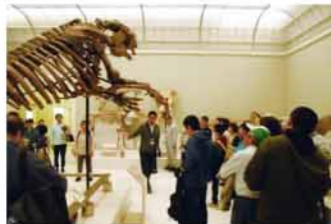
秋の遠足in徳島県立博物館