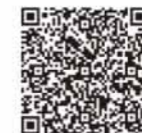
第2やすらぎ事業所