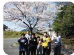
生活介護室外活動